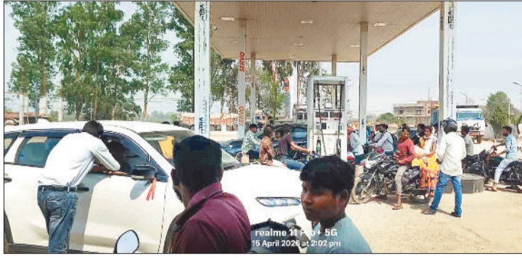
पेट्रोल पम्प में लोगों की भीड़।

खास बात क्षेत्र के दो-तीन पेट्रोल पम्प हो गए हैं झाई