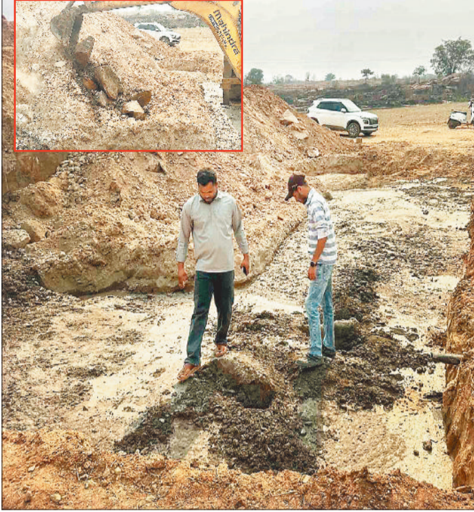
निरीक्षण करते कांग्रेस मीडिया प्रभारी, इनसेट में पत्थर डालते जेसीबी।

जिले के रामानुजगंज ब्लॉक अंतर्गत ग्राम कौशलपुर भैसामुड़ा में लोक निर्माण विभाग द्वारा निर्मित की जा रही पुलिया वर्तमान में भ्रष्टाचार का सबसे बड़ा केंद्र बन चुकी है। पुलिया के सबसे महत्वपूर्ण हिस्से यानी बेस के साथ खिलवाड़ किया जा रहा है। पुलिया के बेस में जहां निर्धारित ग्रेड का कंक्रीट होना चाहिए वहां बोल्टर के डालकर खानापूर्ति की जा रही है। यह न केवल तकनीकी रूप से गलत है बल्कि पुलिया की उम्र को घटाने का काम कर रहे हैं। हैरानी की बात तो यह है कि पुलिया