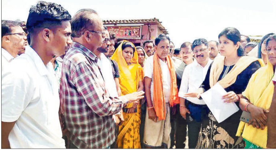
प्रदर्शनकारियों को समझाइश देते अधिकारी।